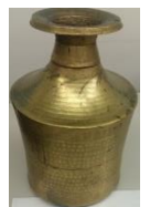
ネパールの水がめ