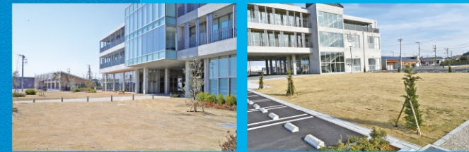
▲イベントスペース1(前庭)