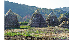
大豆のポツチ積み風景。昔ながらの方法で大豆を自然に乾燥させます。

「小糸在来愛好クラブ」は、小糸在来®の生産振興のために結成された生産者団体です。JAきみつ管内の「販売を目的」とし、「小糸在来®の生産振興のルールを守る」人だけが会員になれます。均一な品質を保つために、優良な品質の系統に種子を統一しており、種子生産に経験豊富な専門農家が種子を生産しています。きちんとした取組みのできるのみが生産者団体「小糸在来愛好クラブ」のメンバーになっています。「小糸在来®」の「種子と商標」は「小糸在来愛好クラブ」のメンバーしか使うことができません。「小糸在来愛好クラブ」のメンバーは、関係機関と連携を深め、技術向上の努力を重ねています。