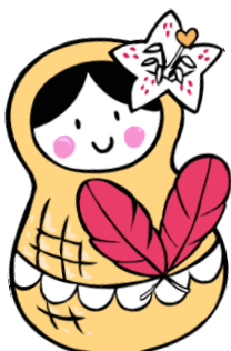
マスコットキャラクター 「そでりん」